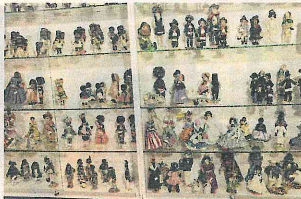
700 dockor uppdelade på tolv montrar finns i stadshusets källare.